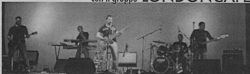
VENETIAN DIRE STRAITS TRIBUTE BAND